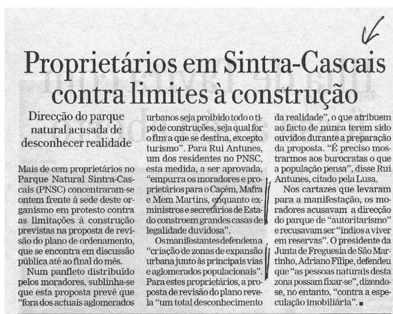
Fig. 6 - Em lugar de se baterem pela defesa do património natural, os proprietários de terrenos nos parques naturais batem-se pelo seu loteamento e construção.

A pulsão construtora dos portugueses leva-os a extremos, como seja insurgirem-se contra a defesa dos parques naturais (Fig. 6) ou disporem-se a morrer para construir (Fig. 7).