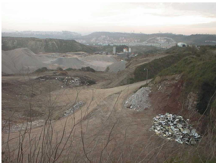
Fig. 3 - Pedreira e depósito de entulhos na zona de Caxias

A construção é uma das actividades com maior impacto ambiental (Fig. 3). Esse impacto está, sobretudo, associado à construção nova, e resulta do consumo de enormes quantidades de materiais, de matérias-primas e de energia. 50% dos recursos materiais extraídos da natureza estão relacionados com a construção. Em Portugal, os mais de 50 milhões de toneladas de inertes utilizados na construção são extraídos em pedreiras, nas praias e em leitos de rios e lagos. A exploração de pedreiras para extracção de inertes constitui uma das principais formas de degradação da componente geológica da qualidade do ambiente. O impacto ambiental da extracção de inertes nas pedreiras é agravado pelo facto de ser quase sempre feito a céu aberto, à elevada relação volume/valor e por não poder suportar grandes custos de transporte, para a sua exploração ser lucrativa. A exploração das pedreiras traduz-se por impactos ao longo das diversas fases