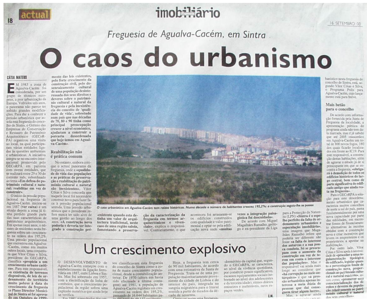
Fig. 2 - O caos urbanístico: o exemplo de Agualva-Cacém.