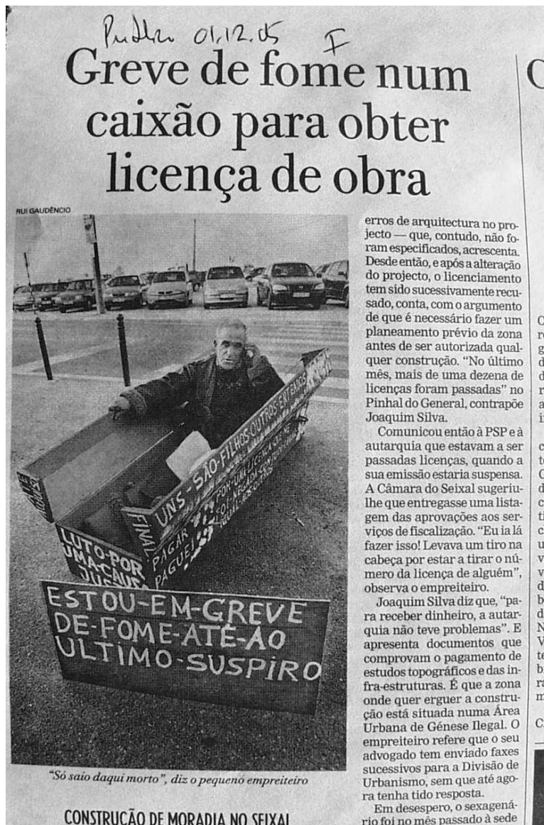
Fig. 7 - Construção ou morte.