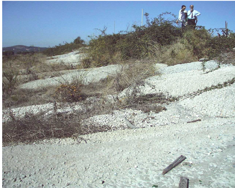
Fig. 4 - Despejo selvagem de sobras de betão.

Acresce o facto dos estaleiros de construção envolverem enormes desperdícios de materiais. Segundo Ércio Thomaz 7 , essas perdas aproximam-se, para alguns materiais, dos 20% (Fig. 4).